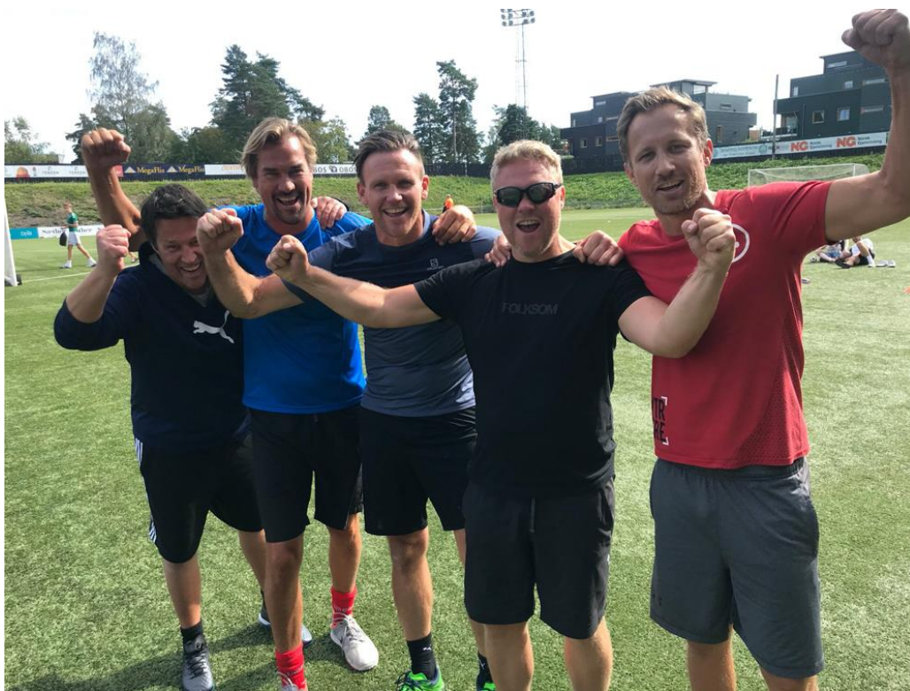
Her er vinnerne av VM i straffekonk 2019.