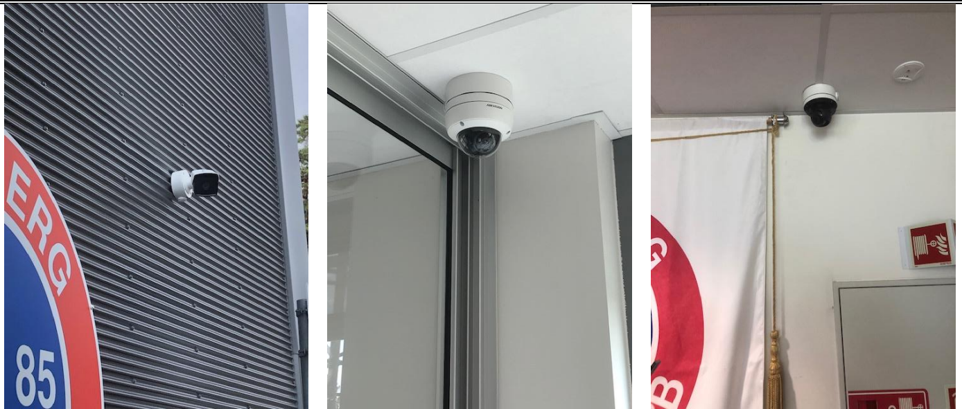
Overvåkingskamera er nå montert både ute (t.v.) og 2 inne i klubblokalene.