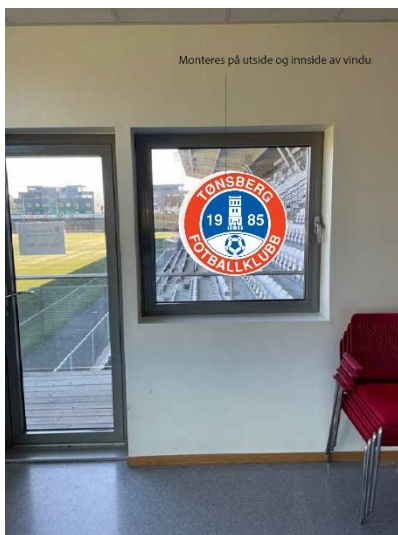
Logo på vinduet mot Gressbanen