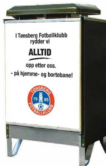
Oppfordring om å rydde opp etter seg på alle søppelboksene