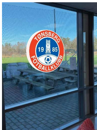
Logo på vinduene til møterommet