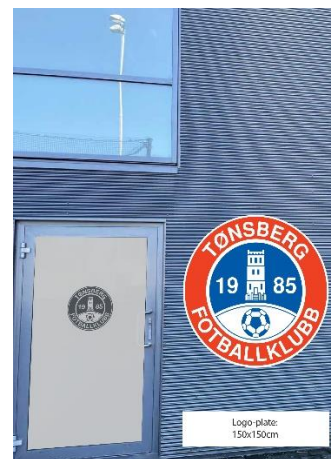
Stor logo på veggen utenfor kiosken