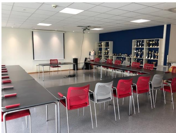
Vi kan være stolte av de flott klubblokalene vi har, og da er det viktig at alle rydder etter seg.